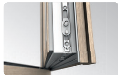
Hochwertige Maco Multi Matic KS Beschläge mit zwei aushebungssicheren Schließblechen als Standardausstattung.