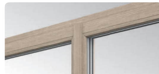
Die schlanke Profile mit schmalem sowie mit doppelter Dichtung ausgestattetem Stulp stellen eine Marktneuheit bei dieser Art von Lösungen dar.